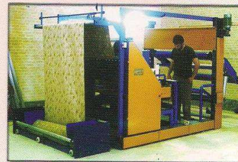
دستگاه کنترل، خرک و رول پیچ اتوماتیک مدل آرشین بافت