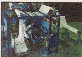
دستگاه باز کن سریع و مهیا ساز پارچه خام بصورت خرک و لامتر مدل چهارمحال