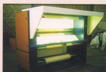
دستگاه کنترل دو طرفه پارچه گرد بافت بغل بسته