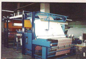
دستگاه کنترل و خرک پیچ و لامترکن با سیستم برش اتوماتیک ضایعات مدل یزد بافت