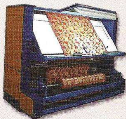
دستگاه کنترل و رول پیچ ساده مدل نساج بابا