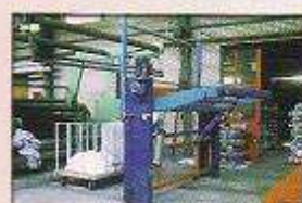
انواع CONTACT WINDER با قابلیت سنکرونیزه شدن الکترونیکی با خروجی دستگاه مورد نظر