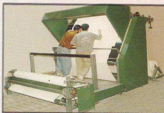
دستگاه کنترل و رول پیچ ساده مدل شین بافت