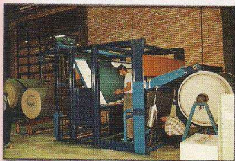
دستگاه کنترل و رول به بیج (خرک پیچ) مدل زرچین