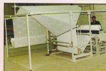
دستگاه دولا و تک لا رول پیچ پارچه تخت عریض با کنترل لبه مدل گل چاپ