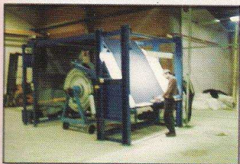
دستگاه کنترل و رول به بیج (خرک پیچ) مدل اکباتان