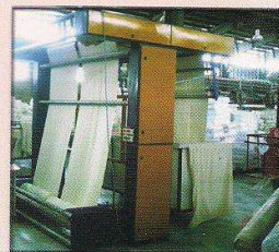
دستگاه رول باز کن سریع و پلیتر پارچه مدل بیستون