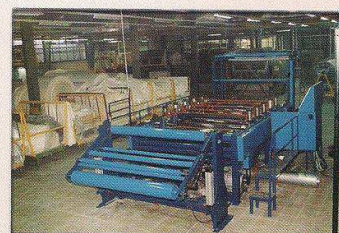
دستگاه برساز و سمباده زنی پارچه مدل درخشان