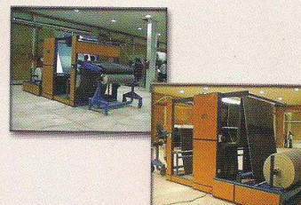
دستگاه کنترل و خرک پیچ مجهز به UNwinder مدل سیلان پارچه