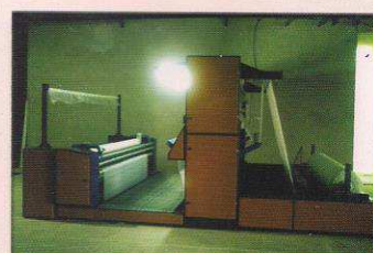
دستگاه کنترل و رول پیچ اتوماتیک مدل سعادت نساجان