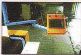
سیستم کنترل کیفیت و گزارشات کامپیوتری