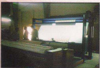
دستگاه کنترل و رول پیچ اتوماتیک مدل پردیس بافت آذر