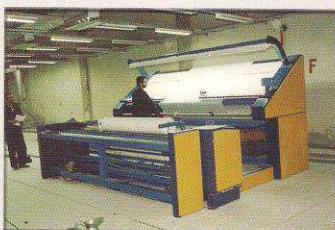
دستگاه کنترل و رول پیچ اتوماتیک مدل حجاب