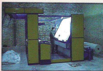
دستگاه کنترل، لامترکن و رول پیچ اتوماتیک مدل هرند