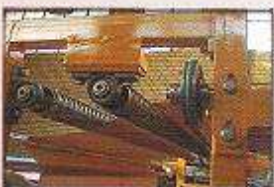
انواع قلمک های چروک باز کن (اسپیرال)