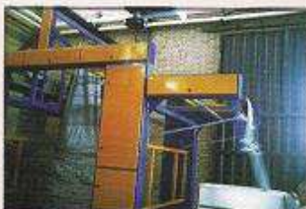
دستگاه پشت و رو کن پارچه گرد بافت مدل نیک ریس