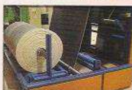
جمع کن مستقل سنکرون مخصوص خروجی winder و باز کن un winder