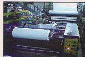
دستگاه دولا رول پیچ پارچه گرد بافت با کنترل لبه مدل دوز دوزانی