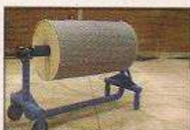
انواع استند و A-FRAME با قابلیت اتصال به سیستم های روتیشن هیدرولیکی و ترمز