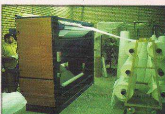
دستگاه کنترل و رول پیچ ساده مدل ترمه آبیگ