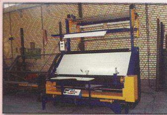
دستگاه کنترل و رول پیچ اتوماتیک مدل کرپ ناز