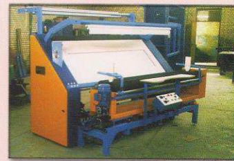
دستگاه کنترل و رول پیچ اتوماتیک مدل شال باف