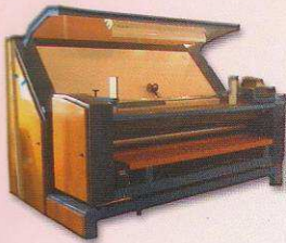
دستگاه کنترل و رول پیچ اتوماتیک مدل ترومل