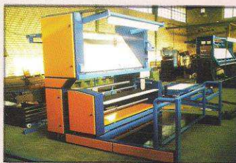
دستگاه کنترل و رول پیچ اتوماتیک مدل شیوا نساج