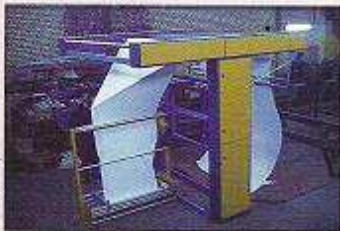
دستگاه برش و باز کن پارچه بغل بسته و لامتر کن مدل پایاتکس