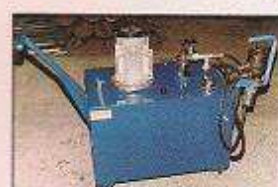
انواع یونیت های هیدرولیکی تکی و گروهی جهت جمع کن انتهای خط یا ایستگاه های چرخش