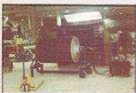
انواع سیستم های مستقل محرک در ورودی از نوع هیدرولیکی