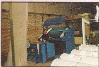
دستگاه کنترل و رول پیچ اتوماتیک مدل پرجین