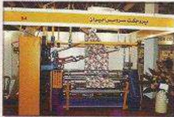
دستگاه طاقه پیچی دولا کتابی مدل صنایع بافت و تکمیل