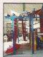
انواع سیستم های لغذیه پرودی بدون کشش اتوماتیک از نوع (S-FORM)