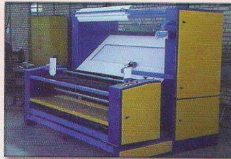
دستگاه کنترل و رول پیچ اتوماتیک مدل شادیلون