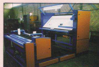
دستگاه کنترل و رول پیچ اتوماتیک مدل پاتن جامه