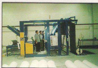
دستگاه کنترل، خرک و رول پیچ اتوماتیک مدل خوی