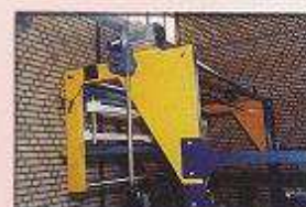
انواع سیستم های سنتر کننده اتوماتیک مدل چهار باند