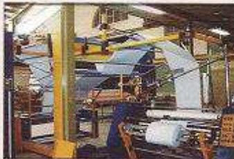
دستگاه طاقه پیچی چهار لا کتابی مدل نقشین